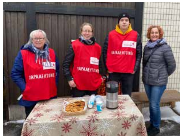
Naantalien osaston vapaaehtoiset jakamassa pipareita ja glögiä sullekans ry:n ruokajakelussa. Kaikkiaan Varsinais-Suomen piirin alueella ruoka-aputoiminnassa oli vuonna 2023 mukana noin 250 vapaaehtoista!