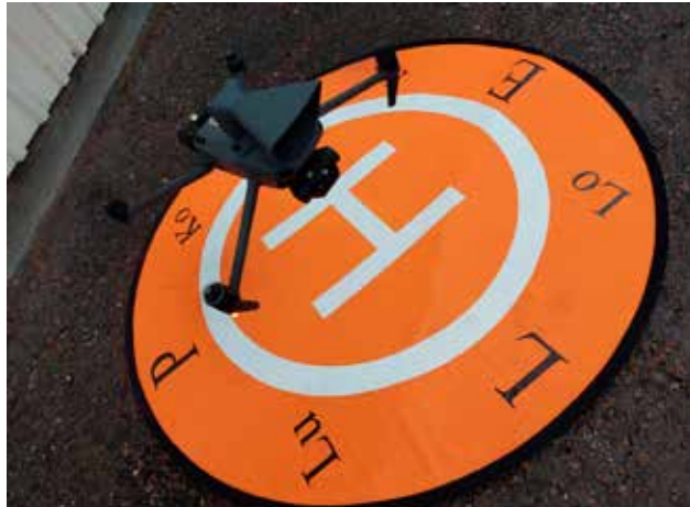
Drone nousemassa alustaltaan. Lisävarusteena lennolla kaiutin.