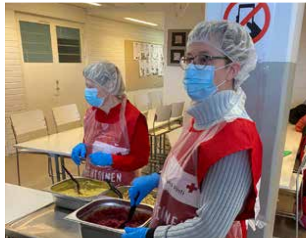
Sauvon osaston vapaaehtoiset jakamassa ylijäämäruokaa Sauvon koulukeskuksessa.