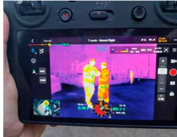
Lämpökamerakuvaa kauko-ohjaajan näkyminä.

Oli kuuma kesäpäivä. Etsimme osana Vapaaehtoista pelastuspalvelua (Vapepa) ikäihmistä todella korkeassa heinikossa, jossa ei nähnyt juuri mitään. Heinikossa oli kauriiden jälkiä. Se esti meitä varmasti päättelemästä, ettei kukaan ollut kulkenut siellä. Kävelimme järjestelmällisesti alueen läpi. Poistuessamme kohteesta totesimme, että olisipa ollut edes jokin leludrone käytettävissä, jotta olisimme nähneet maastoa ilmasta käsin. Silloin ja siinä hetkessä tuli istutettua Sauvon dronehankkeen siemen.