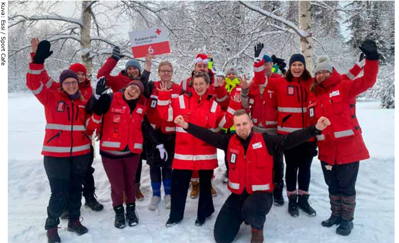
Ensiapuryhmän kouluttajakoulutuksen kurssi numero 6 yhdessä kouluttajien kanssa iloitsemassa hyvin onnistuneesta kurssista.

Ensiapuryhmässä harrastaminen on monipuolista, ja tässä harrastuksessa on aina mahdollisuus oppia jotain uutta! Ensiapuryhmältojen suola on erilaiset kouluttajat erilaisine koulutustapoineen. Ensiavun vapaaehtoiskouluttajana toimiminen onkin yksi mahdollinen harrastuspolku, samoin kuin esimerkiksi päivystäminen erilaisissa tapahtumissa.