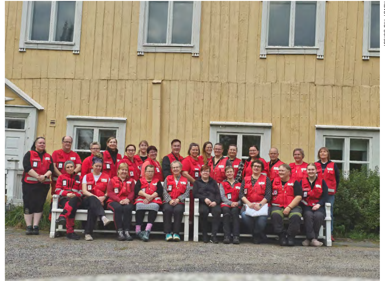
Kurssin päätteeksi otettu ryhmäkuva Nynäsin kartanon edustalla.

Ensiapupäivystystoiminta elää muutoksen aikaa. Esimerkiksi koulutuksia muokataan ja työryhmät luovat myös kokonaan uusia koulutuksia. Tavoitteena muutoksessa on tukea ensiapupäivystäjän osaamista ja rakentaa mieluisa ja helposti saavutettava koulutuspolku vapaaehtoistoiminnan tueksi. Voikin olla, että kyseinen EA3 oli viimeinen nykyisellä sisällöllään ja vastaavaa kurssikokemusta ei ole tulevaisuudessa enää tarjolla. Tästä kurssista jäi hyvät muistot.