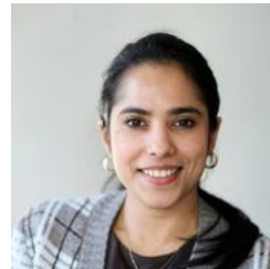
Noor, Kuopion osasto

“Sosiaalista mediaa kannattaa hyödyntää ja panostaa siihen nuorten tavoittamiseksi. Pidetään mielessä myös eteenpäin meneminen: ei jäädä kiinni vanhoihin toimintatapoihin,