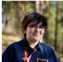
Ville, Tampereen osasto