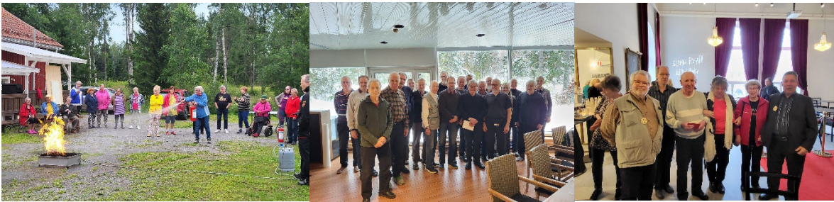
Omaishoitajien leiri, miesten hyvinvointipäivät, vapaaehtoisten kiitosseminaari Tre

Omaishoitajien virkistysleiri järjestettiin heinäkuun ensimmäisellä viikolla Pastuskerissa Meri-Porissa, osallistujia oli 20 sekä 6 vapaaehtoista. Omaishoitajien leiri täytti 30v ja toimintaa juhlistettiin viikon aikana.