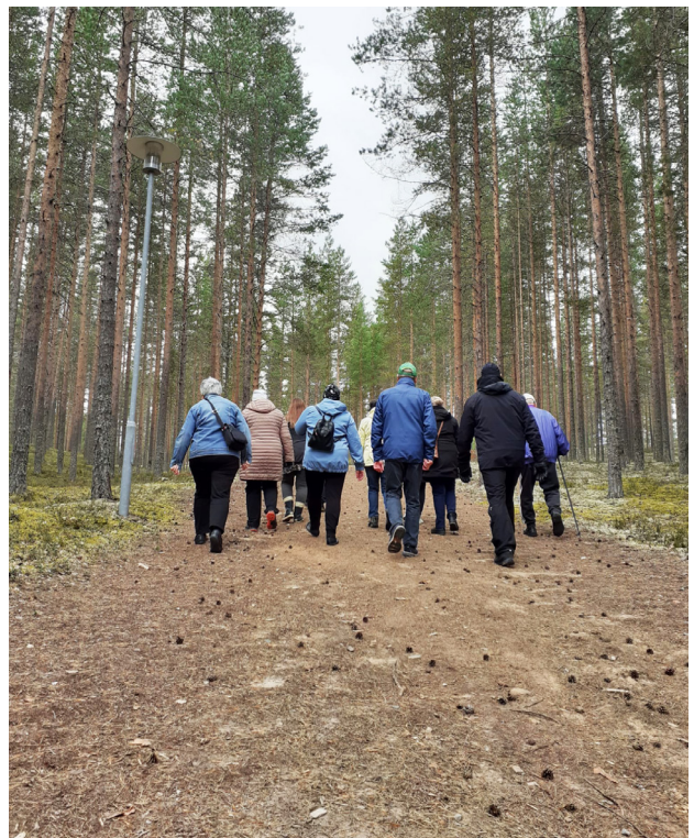
Omaishoitajien hyvinvointipäivät Rokuaalla syyskuussa 2022.