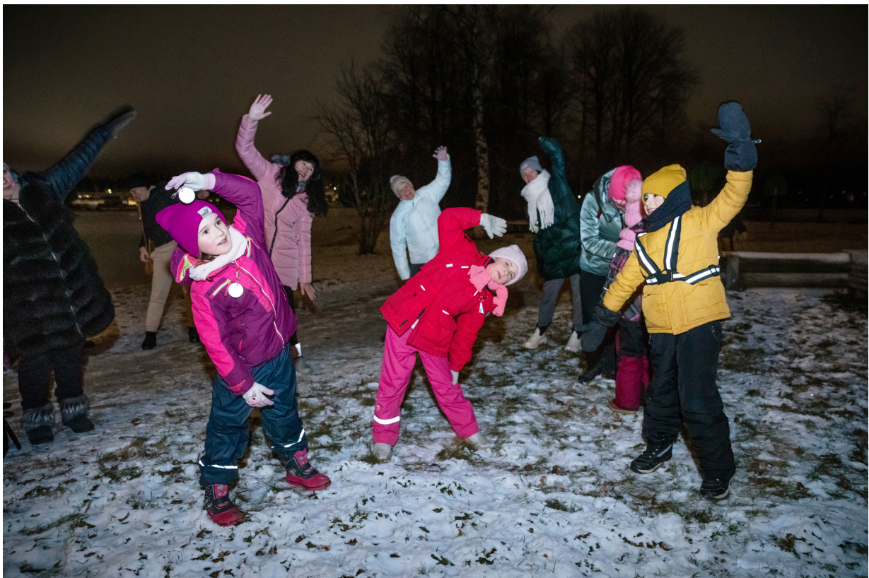
Kotoutumisen tuen vapaaehtoisten ja osallistujien yhteinen pikkujoulu Kajaanissa 25.11.2022.