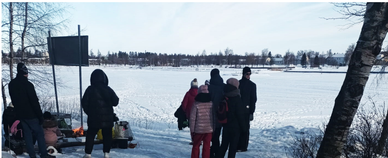
Vastaanottokeskuksen asiakkaiden kanssa talvisella retkellä meren rannalla ulkoilun ja makkaranpaiston merkeissä.

Raahen vastaanottokeskus aloitti toimintansa Ruukin vastaanottokeskuksen sivutoimipisteenä 1.4.2022. Migrin toimeksianton mukainen paikkaluku oli 150. Suurin osa henkilökunnasta rekrytoitiin maalis-huhtikuussa 2022. Samalla aloitettiin majoitus- ja toimitilojen vuokraus ja kalustaminen.