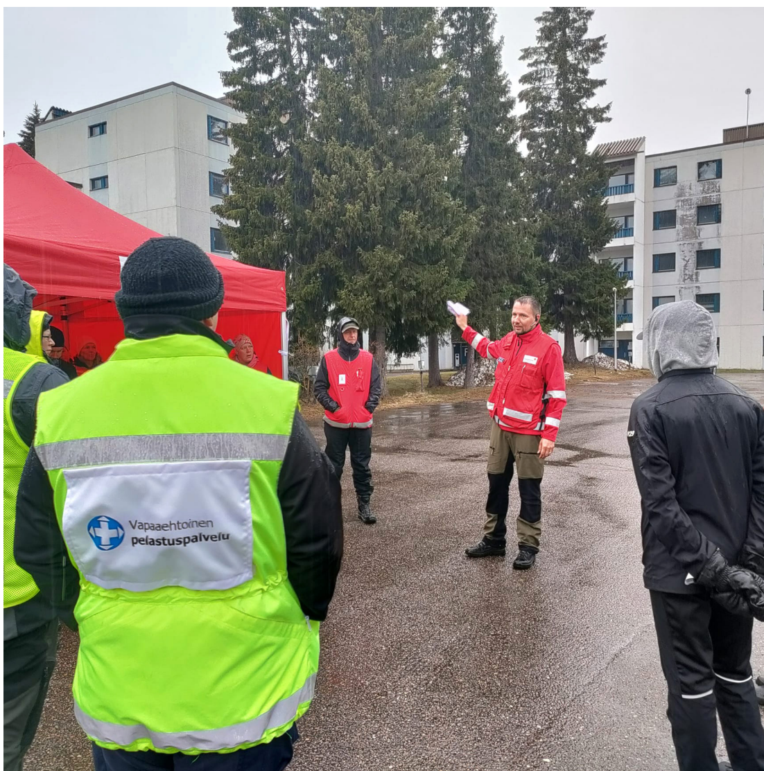
Suoja 22 - harjoitus Raahessa.

*OHTO- hälytysjärjestelmään rekisteröityneitä.