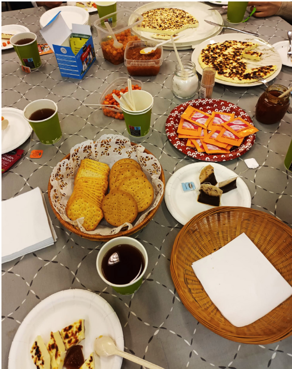
Asiakkaiden kanssa pidetty ruokatapahtuma.

Kotoutumisen tuen toiminnan kyselyn vastausten perusteella pystyttiin suunnittelemaan kerhotoimintaa, joissa asiakkaat ovat itsekin usein mukana toiminnan toteuttamisessa. Lisäksi asiakkaille järjestettiin taidekerhotoimintaa ostopalveluna, liikuntakerhoja sekä erilaisia tapahtumia esimerkiksi vappuna, juhannuksena ja joulun aikaan. Asiakkaiden kanssa tehtiin kesäretki Lännen Tilalle. Lisäksi asiakkaita kannustettiin osallistumaan muihin Raahessa järjestettyihin tapahtumiin, esimerkiksi kaupungin ja TE-toimiston tapahtumiin. Tärkeimpiä yhteistyötahoja olivat Migri, SPR:n piiri- ja keskustuomisto, muut vastaanottokeskukset, Ulkomaalaispoliisi, Raahen kaupungin koulutoimi, sosiaalitoimi sekä terveyspalvelut.