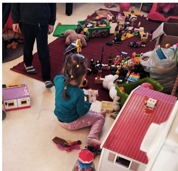
Lapsia leikkimässä kerhotiloissa.

Migri antoi kesän ja alkusyksyn aikana kaksi laajennustoimeksiantoa niin, että lokakuun alusta paikkaluku oli 450. Samalla Raahen irtautui Ruukin alaisuudesta omaksi yksikökseen. Henkilökuntaa palkattiin lisää ja vuoden loppuun mennessä henkilökuntaa oli seuraavasti: johtaja, vastaava ohjaaja, kaksi sosiaaliohjaajaa, kaksi sairaanhoitajaa, toimistos sihteeri, etuuskäsittelijä, yhdeksän ohjaajaa, yhteensä 17 työntekijää. Rekrytointeja jatkettiin vuoden 2023 puolelle. Työntekijöille järjestettiin koulutusta, esimerkiksi EA1-koulutusta ja työnohjausta. Myös SPR:n ja Migrin koulutuksiin osallistuttiin aktiivisesti.