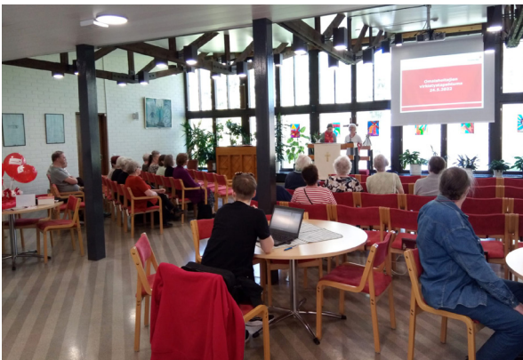
Omaishoitajien tapahtuma toukokuussa 2022 Kärsämäellä.

Oulun piirissä omaishoitajia tavoitetaan jo nyt paljon terveystieteiden, kohtaamiskahviloiden ja ystävöiminnan parissa, joten sulauttamisen onnistumiseksi omaishoitajien tukitoimintaa toteutetaan tulevana vuonna paljon yhteistyössä muun ystävöiminnan tekijöiden kanssa, jotta toiminta omaishoitajien parissa tulisi tutuksi ystävöiminnan tekijöille piirissä ja muiden vapaaehtoisten keskuudessa.