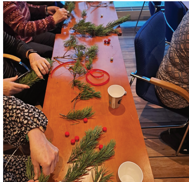
Monimuotoisen ystävätoiminnan koulutus- ja virkistyspäivät Rokualla.

Henkinen tuki siirtyi 2023 sosiaalitoiminnan suunnittelijan työtehtäviin. Toiminnan kehittäminen aloitettiin Lyyti-kyselyllä, jonka avulla kartoitettiin tarpeita ja toiveita toiminnan