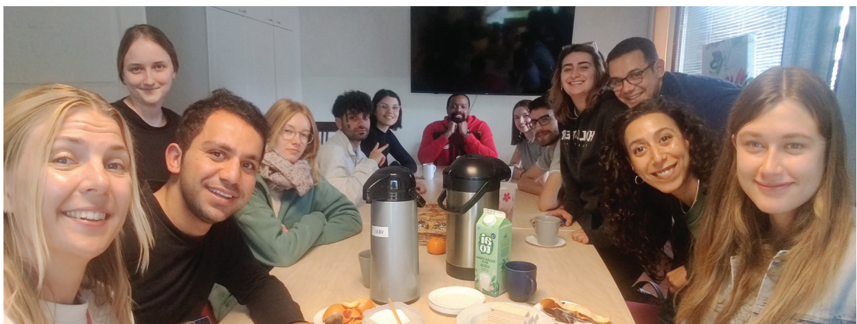
Vapaaehtoistiimin nuoret Kuusamossa.

Humanitaarisesta oikeudesta käytiin myös puhumassa Tuiran seurakunnan ja Oulun osaston järjestämässä tapahtumassa marraskuussa.