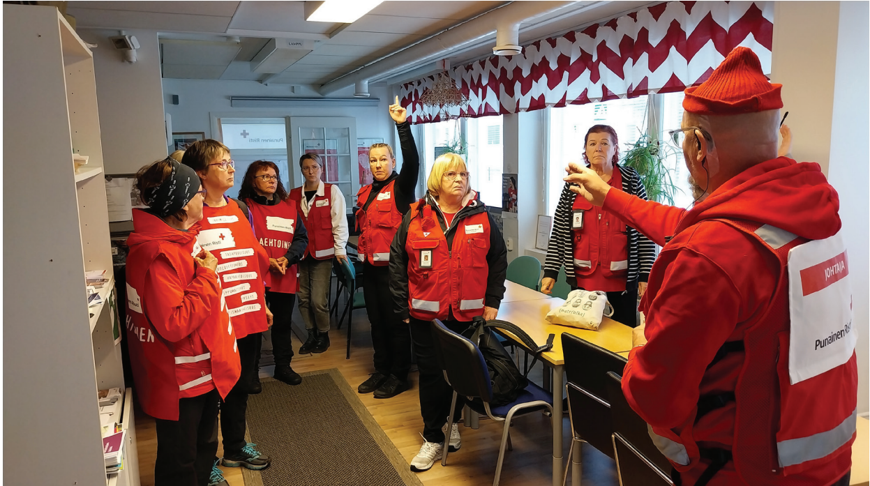
Kainuun lentoaseman yhteistoimintaharjoituksesta.