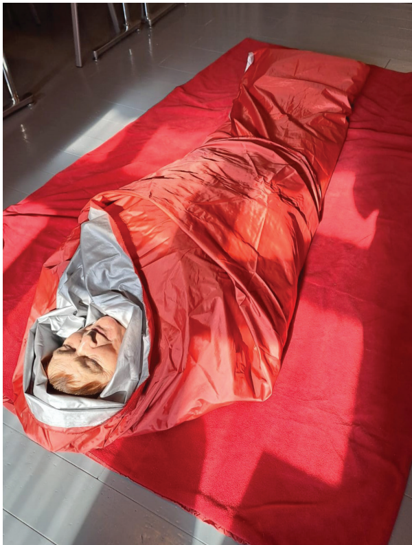
Te-vapaaehtoisten EA1 -kurssi Hietalinnassa.

Terveyspisteiden vapaaehtoiset ovat tehneet aktiivista yhteistyötä ja kasvattaneet paikallisenä näkyvyyttään yhteistyötoiminnoilla niin paikallisjärjestöjen, asukastupien, terveystoimijoiden kuin seurakunnan ja SPR:n muiden toimintaryhmien kanssa. Terveyspisteet ovat muun muassa jalkautuneet ruoka-avun tapahtumiin ja jo