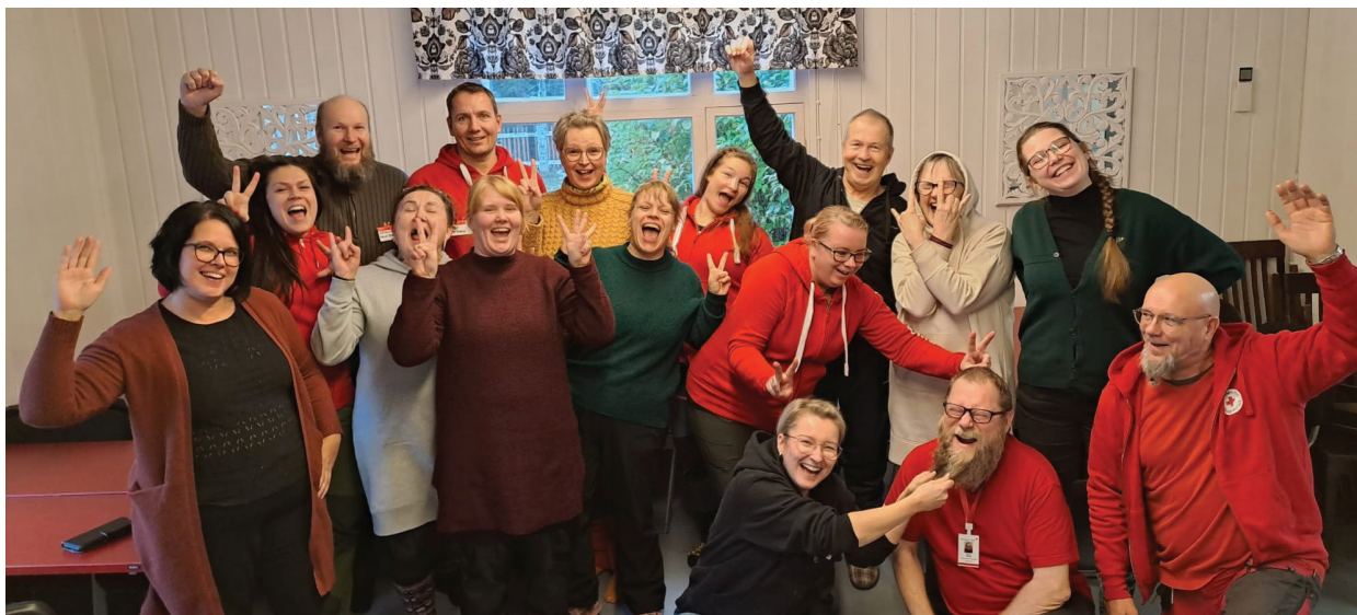
Kuvaaja: Satu Kipinä. Ensiapupäivystäjien peruskurssi Hietalinnassa.

Kauan odotettu EA3@-kurssi ei toteutunut vuoden aikana muun muassa terveydenhuollon suunnittelijan työntekijävaihdoksen vuoksi. Myöskään ensivastetoimintaan ei saatu toivottua sopimusta Pohteen ja Kainuun hyvinvointialueiden aloittaessa vuoden vaihteen jälkeen. Ensiapuryhmien avainhenkilöille järjestettiin vuoden aikana kaksi tapaamista Teamsin kautta, jossa ensimmäisessä keskityttiin muun muassa yhteistyön mahdollisuuksiin, ja toisessa käytiin läpi tulevia ea-toimintalinjauksia kaudelle -24-26 sekä niiden vaikutusta osaston ea-ryhmän toimintaan. Tällaisia tapaamisia kaivataan, mutta osallistumismäärät ovat olleet vähäisiä. Vain pieni osa eri osastojen ea-ryhmän avainhenkilöistä on saavutettu yhteisillä foorumeilla.