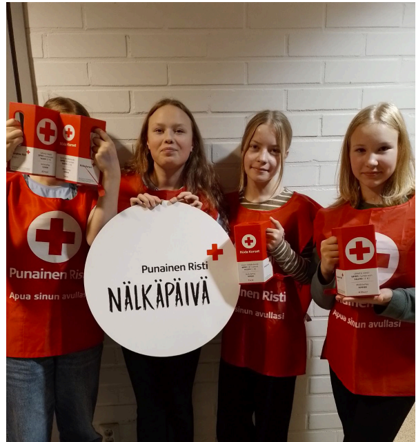
Koululaiset osallistuivat reippaalla mielellä keräykseen.