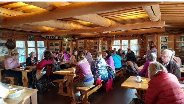
Savottakahvilassa maistui kahvit suolaisella ja makealla.