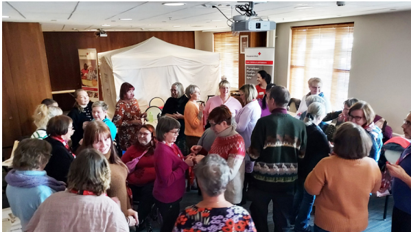
Tutustumisessa kävi iloinen puheensorina. Taustalla pakolaistelta.

Iltapäiväkahville siirryttiin Savottakahvilaan, jossa purettiin ennakkotehtävää. Sen aiheena oli pohtia mm. sitä, mikä motivoisi toimintaan, mitä toiminnasta saa, ja mitä vinkkejä voisi muille jakaa. Keskustelussa nousi esiin, kuinka palkitsevana vapaaehtoiset kokevat oman tehtävänsä. Tarpeellisuuden tunne, oman toiminnan merkittäväksi kokeminen sekä ystäväsivakoiden antama sydämestä tuleva kiitos ovat äärimmäisen tärkeitä asioita. Lisäksi muistutettiin, siitä kuinka tärkeää on pysyä oman jaksamisen rajoissa. Huolta aiheutti vapaaehtoisten rajallinen määrä samoin se mistä saadaan uusia mukaan.