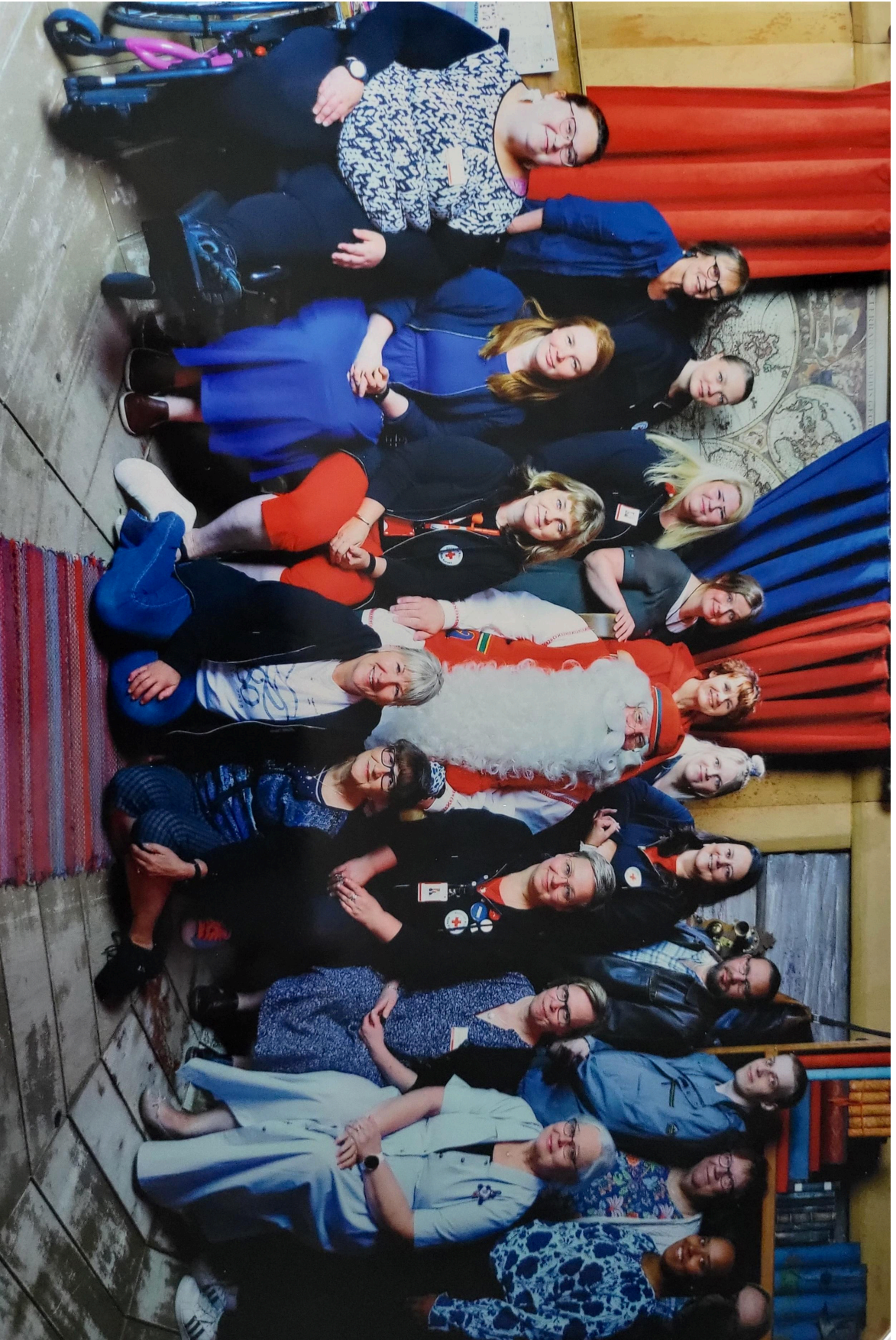
Lapin piirin hallituksen jäsenet ja piirin työntekijät toivottavat mukavaa alkusyksyä osastoihin. Joulupukin sanoin: jatketaan yhdessä hyvää työtämme, sillä mieltä tarvitaan.