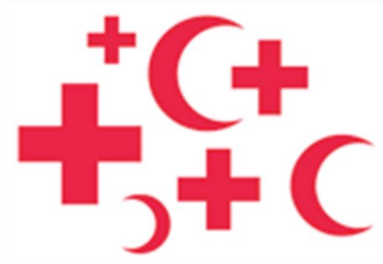
Kansalliset yhdistykset 190 yhdistystä - Päätoimija