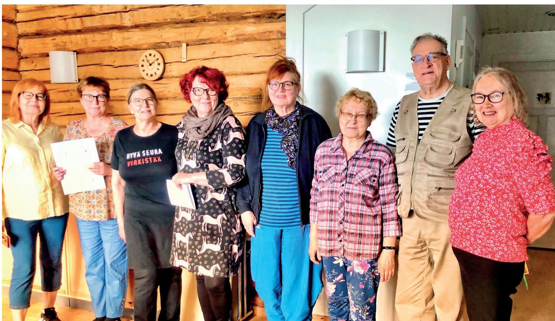
Tuusulan osaston vapaaehtoiset osallistuivat vahvuustyöpajaan kesäkuussa.