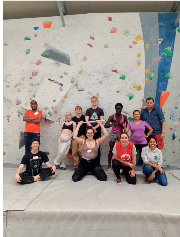
Kesäklubilaiset pääsivät haastamaan taitojaan kiipeilyseinällä Tammistossa.