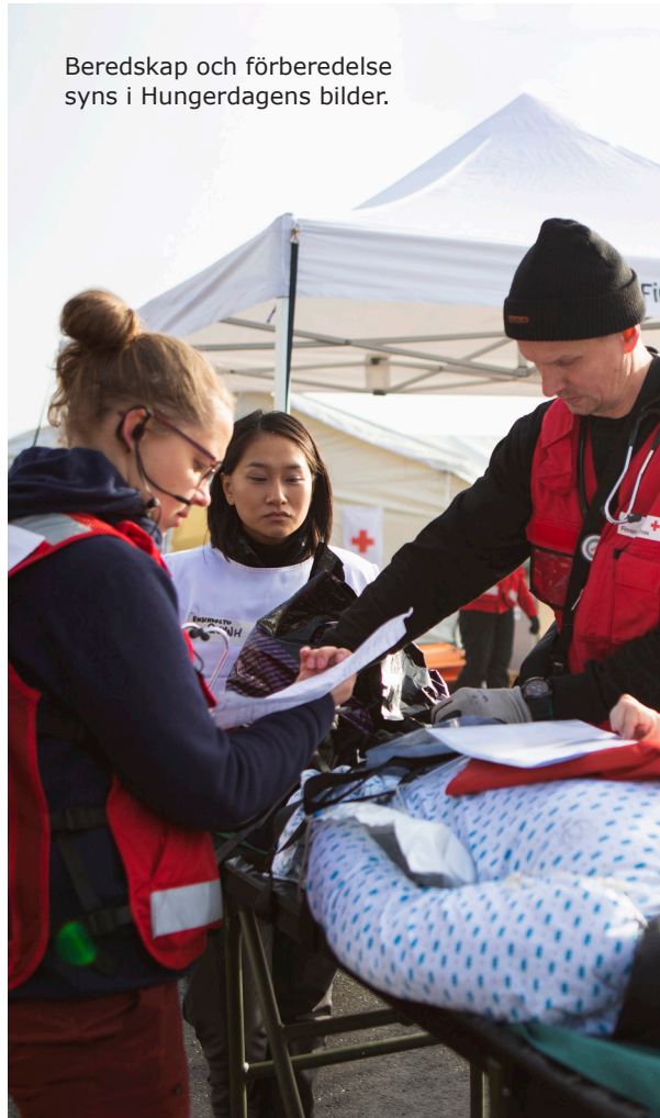
Beredskap och förberedelse syns i Hungerdagens bilder.