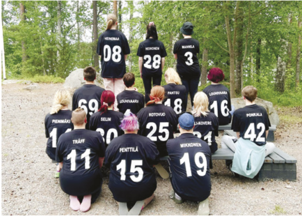
Ensiapuleirin ohjaajat ja pomot 30.6.