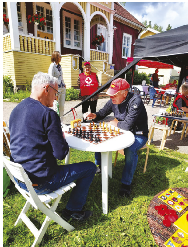
Heinäkuussa Noitakäräjien Käräjätörrillä pelattiin ulkona "pikashakkia".