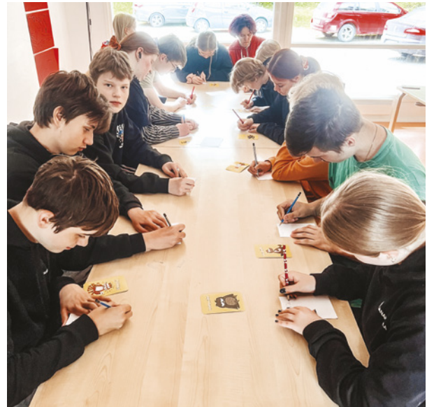
Nuoret antamassa palautetta yöharjoituksesta fiiliskorttien pohjalta 2.7.