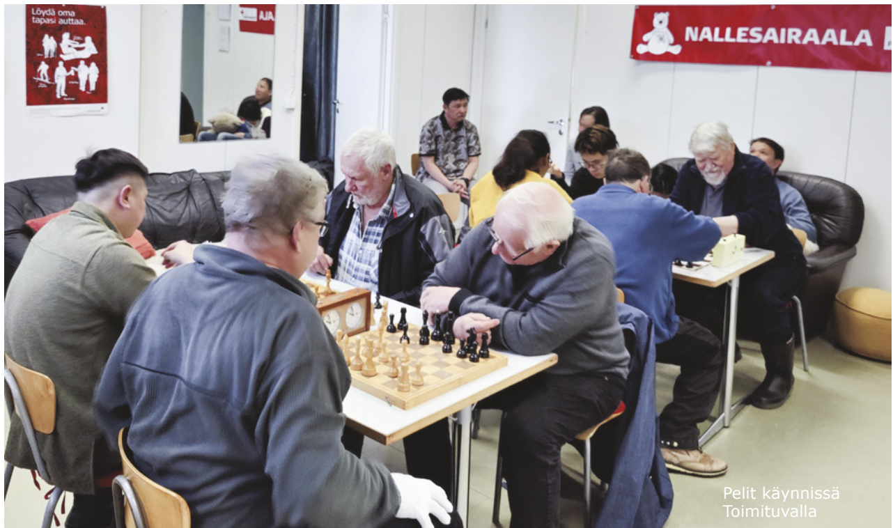
Pelit käynnissä Toimituvalla