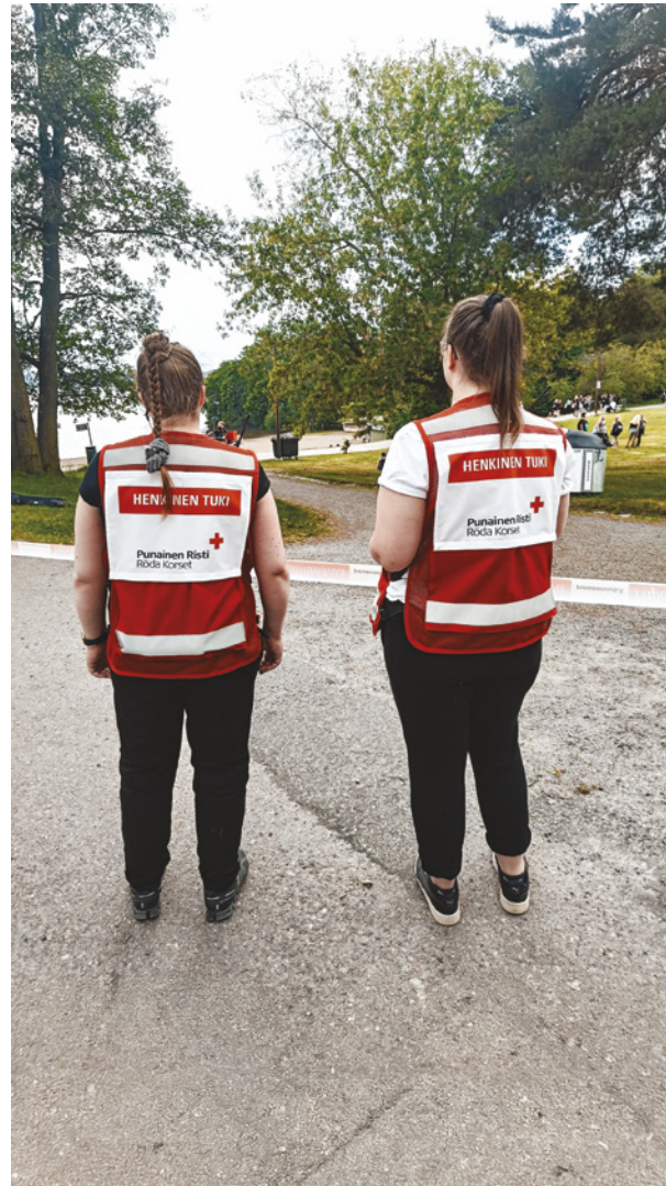
Kuva: Johanna Raiwo