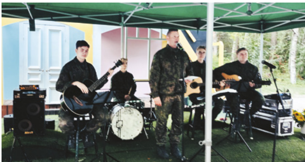
Panssariprikaatin varusmiestoimikunnan bändikerho