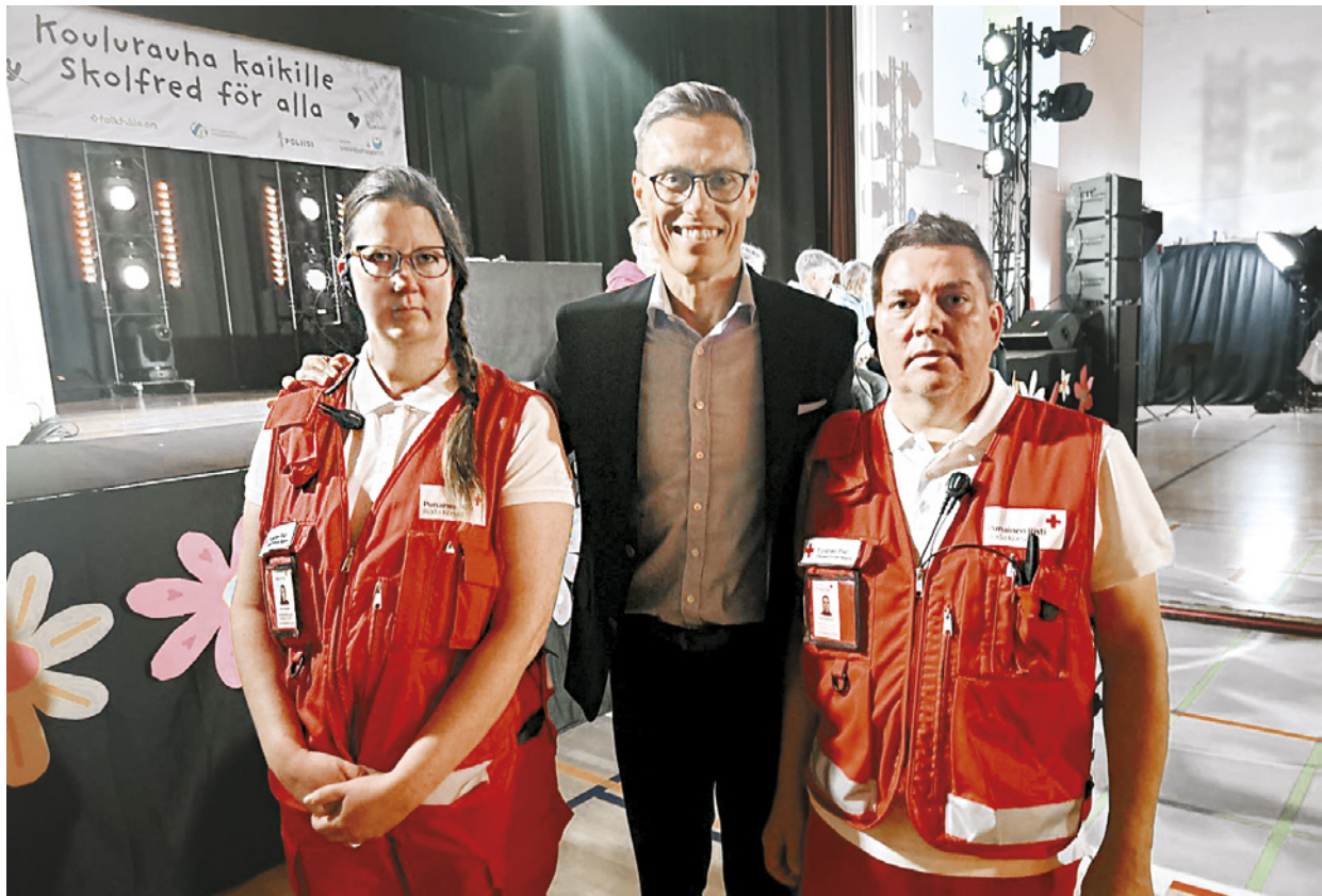
Kuvaaja: Presidentin kanslia