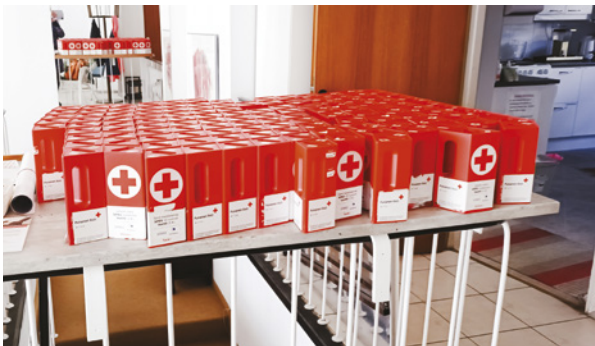
Osa lippaista odottamassa laskentaa.