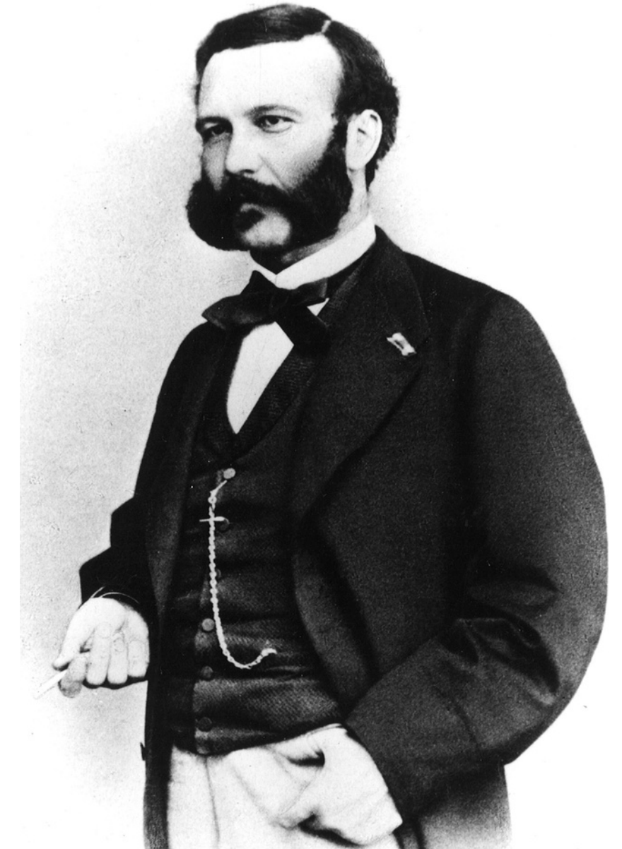
Suomen Punainen Risti

Henry Dunant oli sveitsiläinen liikemies, joka perusti Punaisen Ristin nähtyään sodan tuhot taistelulentällä Solferinossa 1859. Dunantilla oli kaksi ajatusta: kouluttaa rauhanaikana vapaaehtoisia auttamaan sodan uhreja ja luoda säännöstö sodan laeiksi. Dunantin perintö elää edelleen tänään kaikissa 190 kansallisessa yhdistyksessä, joita on ympäri maailman.