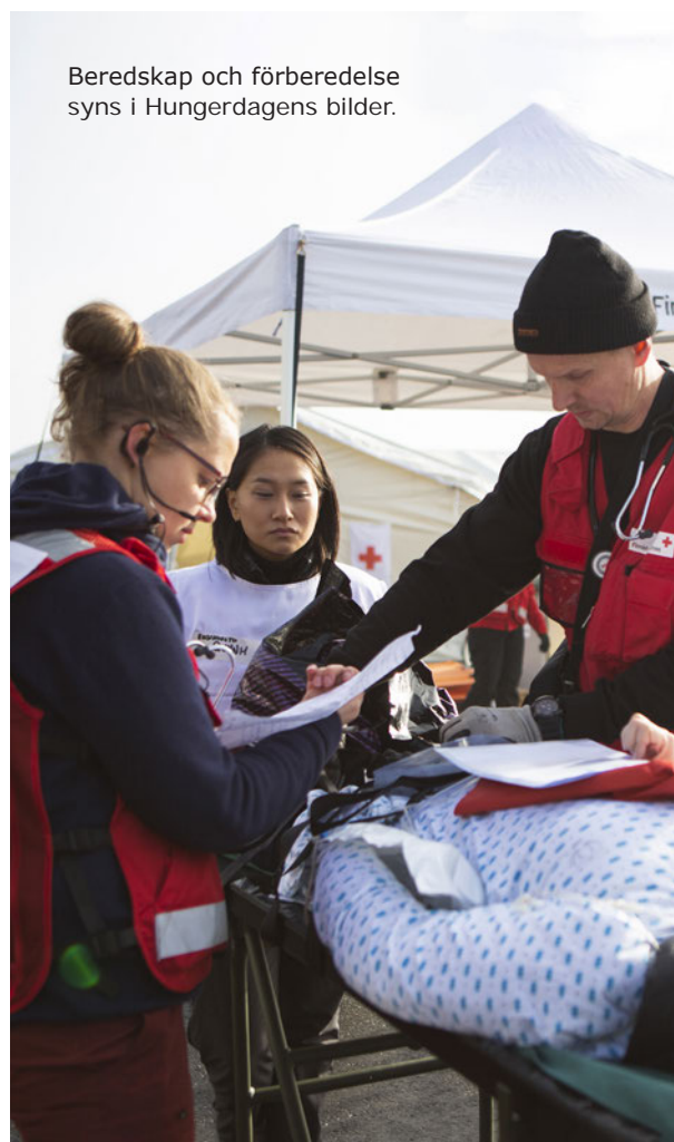
Beredskap och förberedelse syns i Hungerdagens bilder.