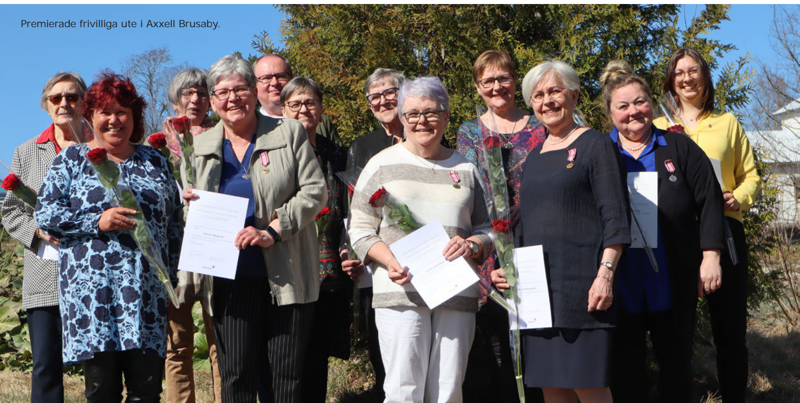
Premierade frivilliga ute i Axxell Brusaby.