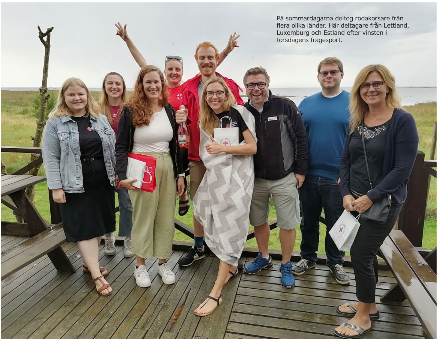
På sommardagarna deltog rödakorsare från flera olika länder. Här deltagare från Lettland, Luxemburg och Estland efter vinsten i torsdagens frågesport.

På lördagen, själva seminariedagen, presenterades Eesti Punane Rist för oss. I fokus var förstas de frivilliga och frivillighet eftersom det var seminariets huvudtema. Hur engagerar och motiverar vi våra frivilliga diskuterades också. De utländska deltagarna berättade i sin tur om hur Röda Korset verkar i respektive land. Det finns olikheter gällande verksamhetens inne-