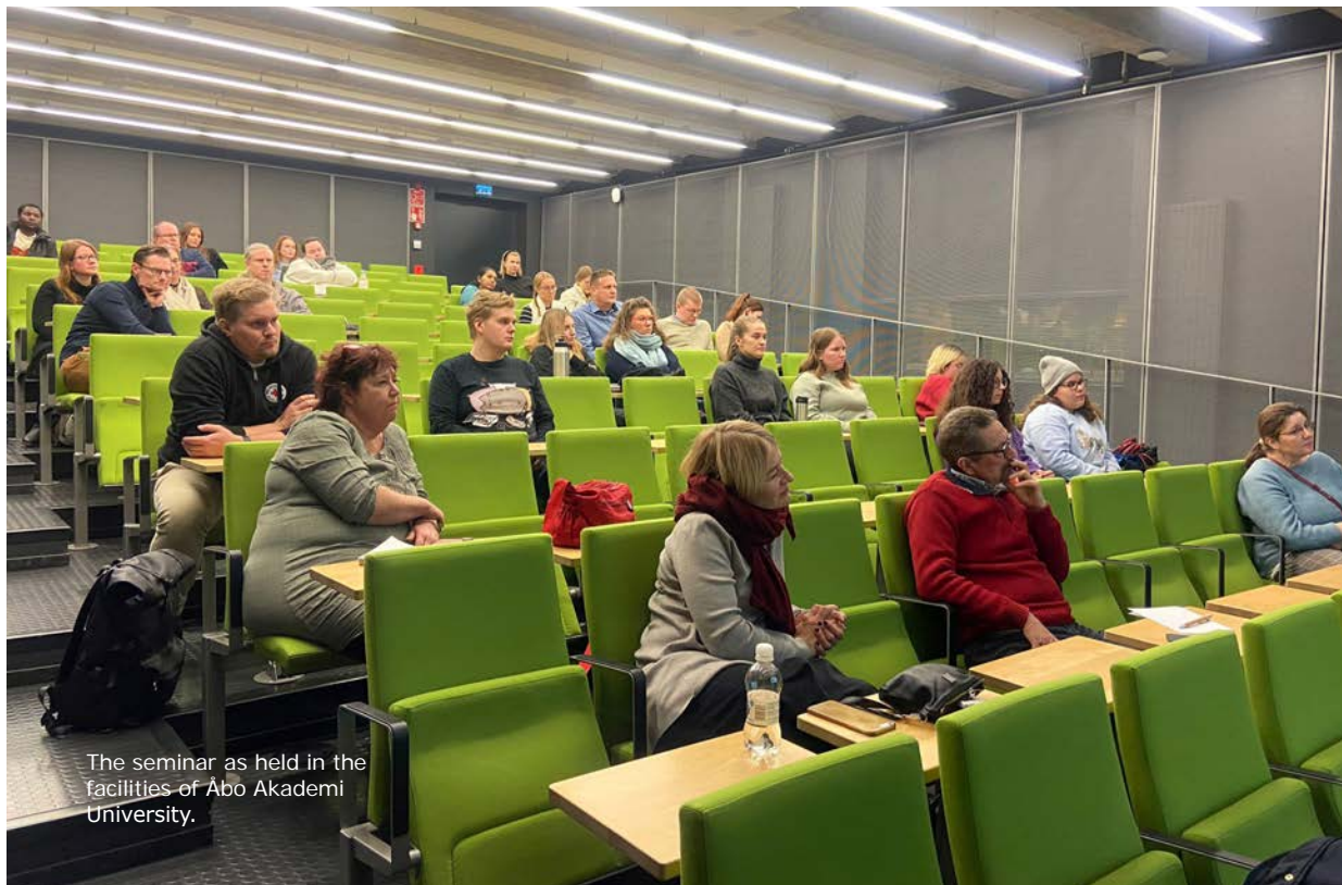
The seminar as held in the facilities of Abo Akademi University.

ed on ideas of aid to wounded soldiers and rules regulating actions on the battlefield. It is therefore vital that knowledge of IHL, its application, and the role of the Red Cross within it is widely spread among those who work or volunteer with the Red Cross, as well as everyone else who keeps up with current world affairs.