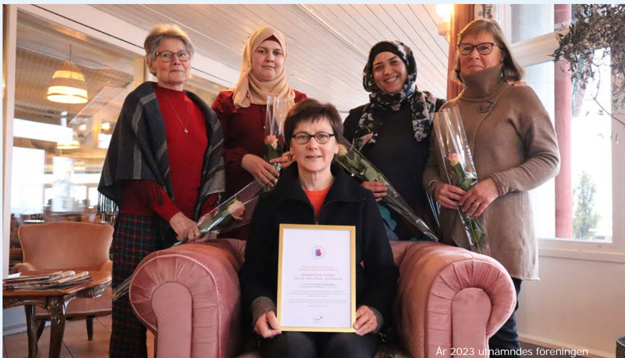
År 2023 utnämndes föreningen Skärgård utan gränser till Årets fördomsfria föregångare. Vem blir det i år?