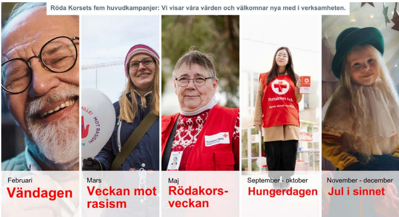
Röda Korsets fem huvudkampanjer: Vi visar våra värden och välkomnar nya med i verksamheten.

Här har vi en bra plan att följa som vi tagit fram tillsammans under höstens träffar och möte. Med fokus i blicken och ett stort leende ser jag fram emot tre kommande år tillsammans med er!