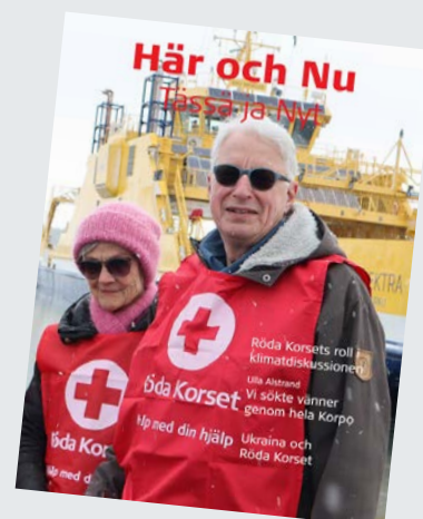
Så här såg medlemstidningen ut förra året.