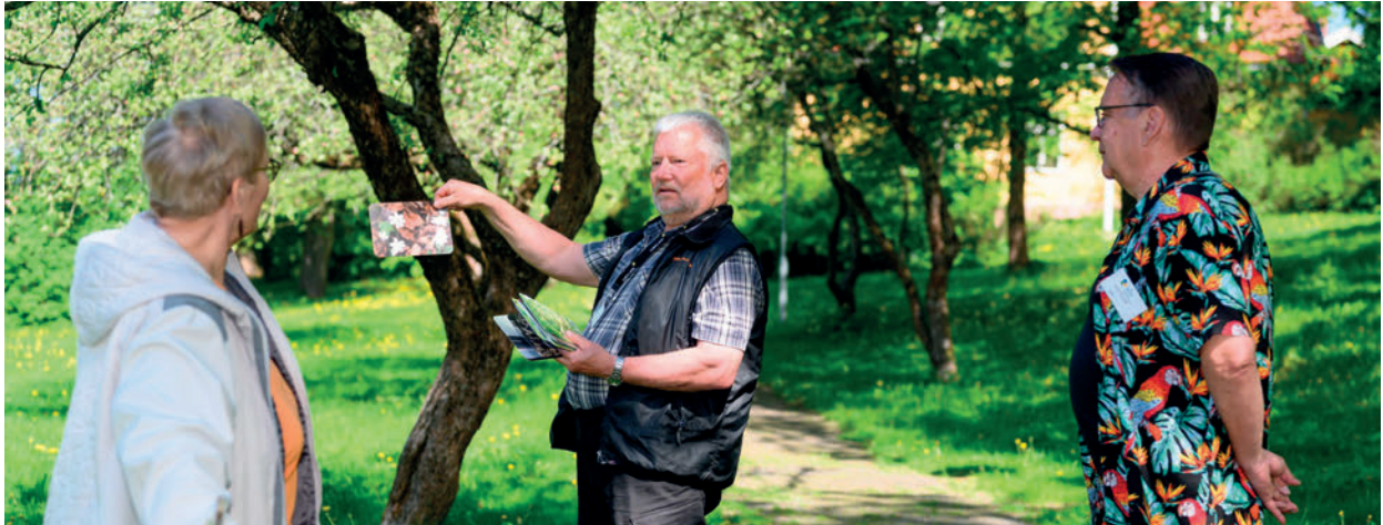
På en bjudning med temat natur kan det handla om att tillsammans känna igen växter.

re leder diskussionen under bjudningen, om ett tema som har överenskommit på förhand, såsom litteratur, motion eller musik.