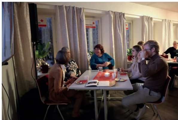
Distriktet bjöd in till varm stämning och julstjärnor en eftermiddag i december.