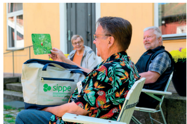
Under en sippebjudning är det den frivilliga som leder diskussionen om ett tema som är överenskommet på förhand.