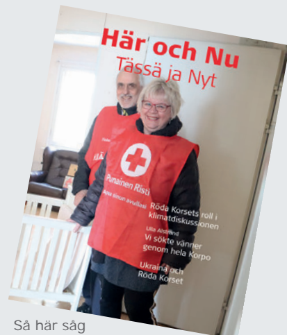
Så här såg medlemstidningen ut förra året.