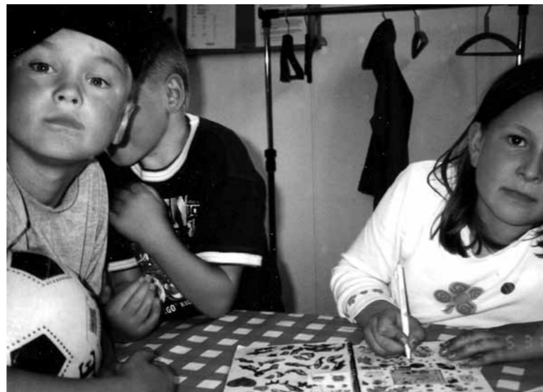
Eftis ordnades i avdelningens lokal i Vreta med frivillig personal, foto 2002

Maj-Britt arbetade som gymnastiklärare och