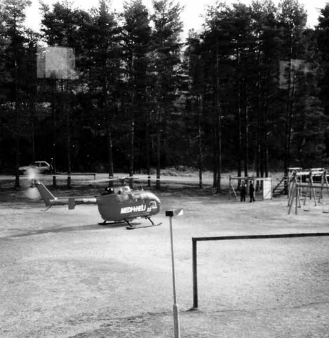
Medi-Heli gratulerar den 50-åriga avdelningen 2002