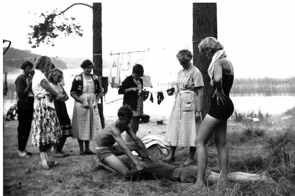
Första hjälpen träning på stranden

Avdelningen hade liksom en, dom hade inte