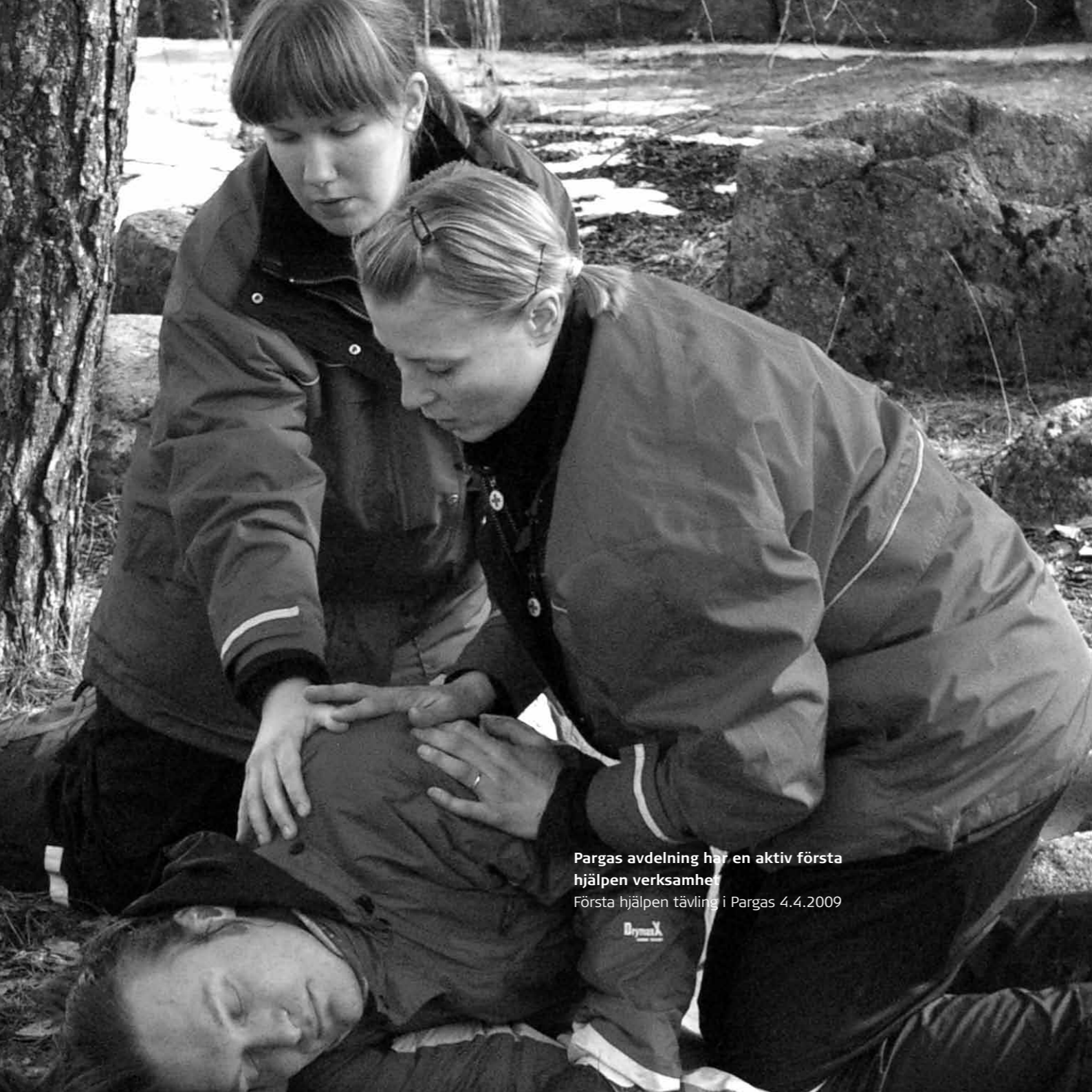
Pargas avdelning har en aktiv första hjälpen verksamhet. Första hjälpen tävling i Pargas 4.4.2009