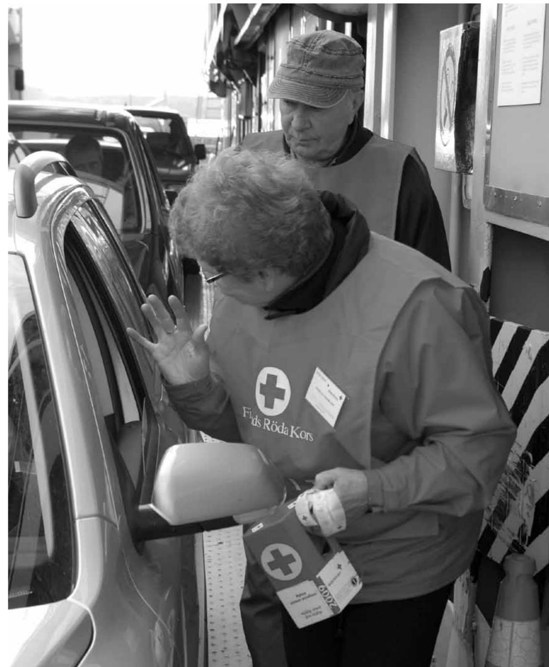
Hungerdagsinsamling på Nagu färjan 2008

Hungerdagsinsamlingarna har vi varit med i varje år, sparbössor har funnits på färjorna och en del av skolornas matpengar går till insamlingen.