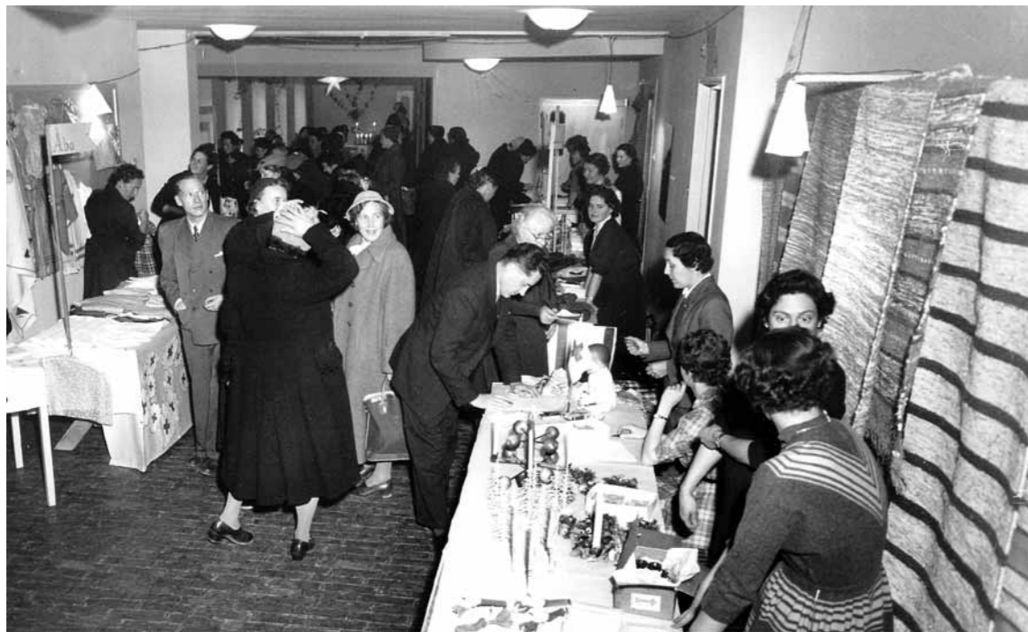
Basarer ordnades årligen i Åbo

den. Om det var något större jippo så gick det till Katastroffonden. Vi ordnade barnfester också på Åbolands sjukhus. Det var jätteroligt. Där var ju då det där Barnvårdsinstitutet och de där flickorna ställde ju gärna upp.