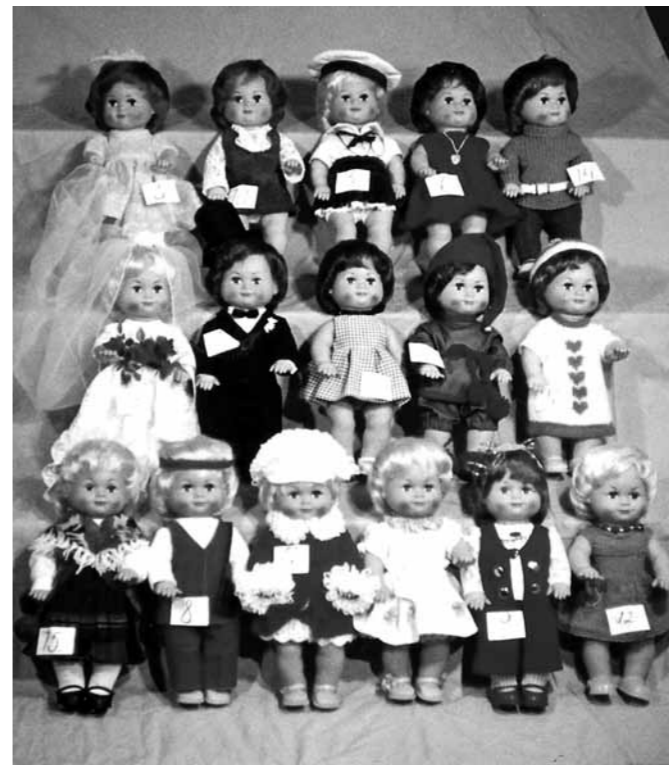
Utställning av dockor på Kimito bibliotek 1971