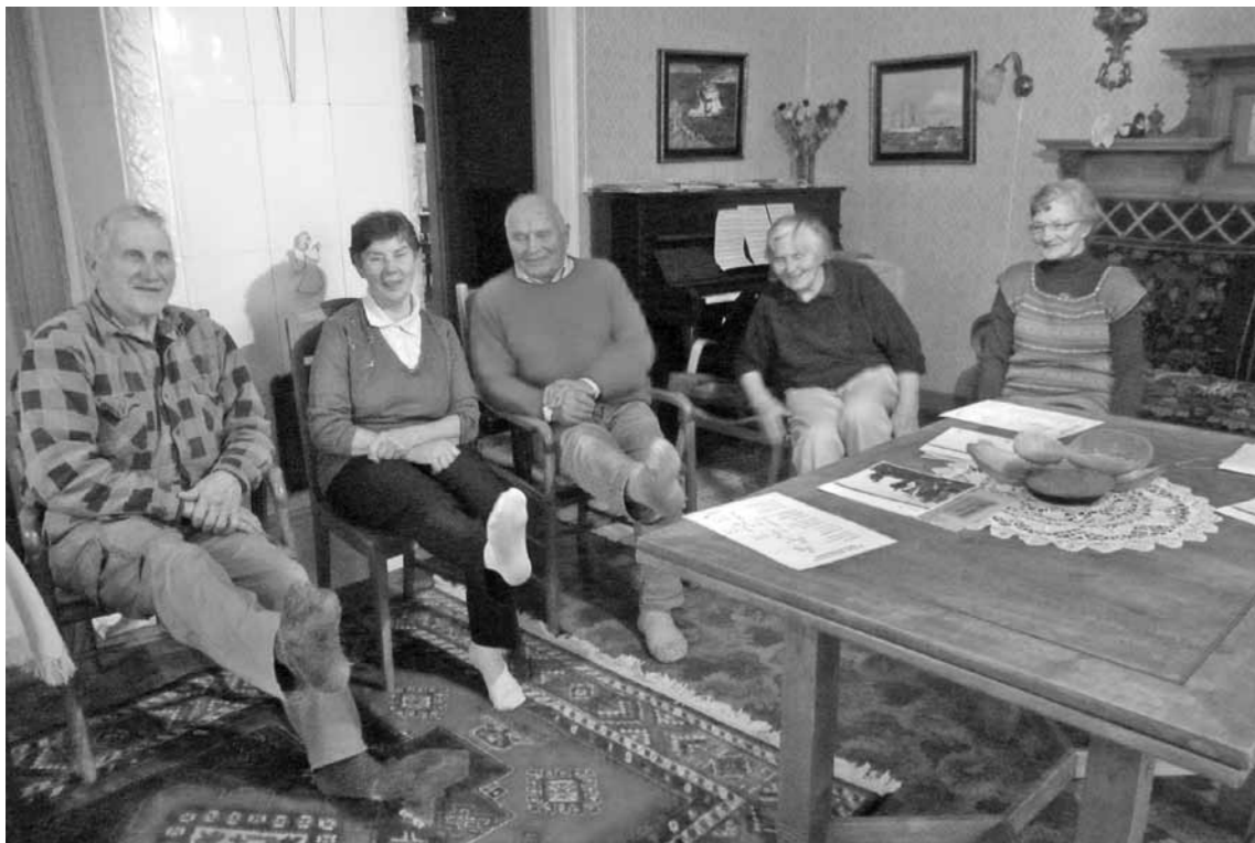
Hitis avdelning deltog aktivt i glesbygdsprojektet EHYT 2007-2009. Här deltagare i gymnastikprogrammet för äldre "Dopp i galopp".