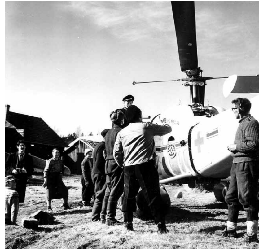
Hyrd ambulanshelikopter från Sverige transporterade patienter till Åbo i menförestider från skärgården, 1959

COT: Inte vet jag om det var utbildningen el-