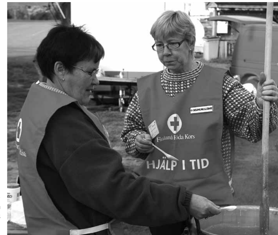
Saltcheck för Hungerdagens ärtsoppa 2008