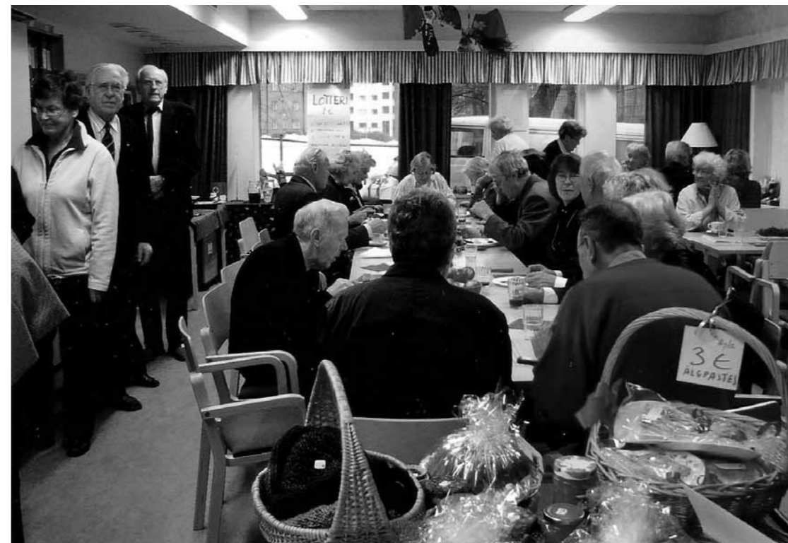
Jullunch på Nya Hörnan

GT: Mera om Hörnan, efter 5 år konstaterade staden att de behöver de där utrymmena och då skulle vi ut. Vi hade då skaffat vår inredning dit till Hörnan, det var faktiskt två rum och kök, så vi hade då småningom samlat, möbler hade vi dels tiggat och fått, vi hade inte egentligen köpt nånting. Från Akademin fick vi något bord som ha-