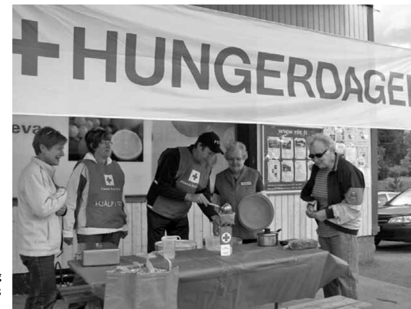
Rotmosförsäljning Hungerdagen 2008