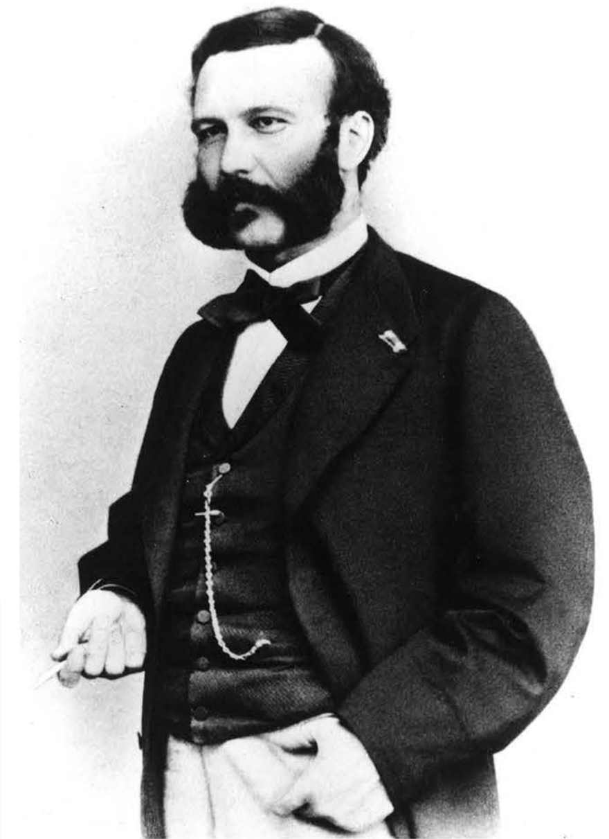
Finlands Röda Kors

Henry Dunant var en schweizisk handelsman som grundade Röda Korset efter att ha sett förödelsen på slagfältet i Solferino 1859. Dunant hade två idéer: att under fredstid utbilda frivilliga att hjälpa krigets offer och att grunda ett regelverk för regler i krig. Dunants arv lever kvar i dag i alla de 190 nationella föreningar som finns runt om i världen .