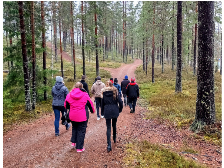
Nuorten ystäväleiri Kajaanissa