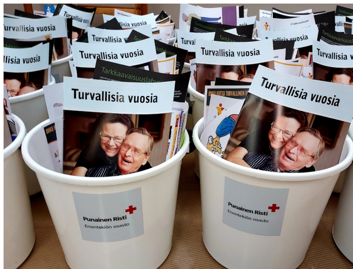
Turvallisuusämpärit Peltovuomassa Enontekiöllä

Savukoski-Pelkosenniemiellä ei kohtaamispaikalle ollut tarvetta. Alueella päätettiin järjestää kohtaamispaikan sijaan tapahtumat. Savukoskella tehtiin tutustumisretki Martin kylän entiselle koululle. Siellä tarjotaan kotihoitoa ikäihmisille ja se koettiin kiinnostavaksi tutustumiskohteeksi. Kunnan kotipalvelun kanssa tehtiin yhteistyötä ja saatiin tapahtumaan mukaan 10 ikäihmistä. Pelkosenniemiellä tarjottiin tutustumisretki Pyhätunturin Luontokeskukseen kohdennettuna erityisesti niille ikääntyneille, jotka harvoin pääsevät osallistumaan tapahtumiin. Tässäkin tehtiin yhteistyötä kotipalvelun kanssa. Osallistujia oli 10.