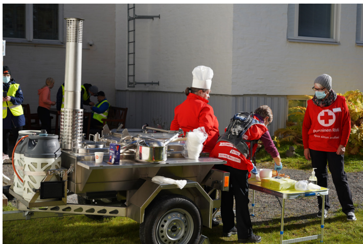
Lähteentien tapahtumassa tarjoiiltiin makkarakeittoa

Rovaniemellä ruoka-aputoiminta osallistui vahvasti Asunnottomien yö tapahtumaan sekä Ensi- ja turvakodin järjestämään leikitään ja lauletaan tapahtumaan. Ruokaa ja kohtaamisia hankkeen (2020) aloittama bingo ja kahvittelu toiminta jatkui Kolarissa, yhteistyökumppaniksi toiminnalle löytyi paikallinen S-market.