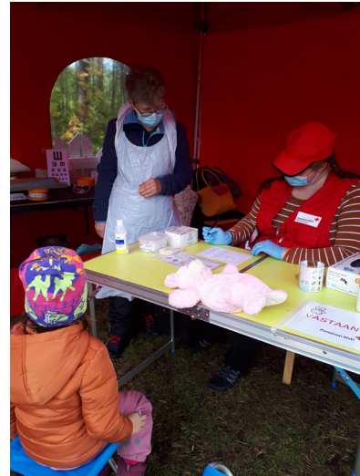
Nalle sairaala Lähteentien tapahtumassa.

Päihdetyötä toteutettiin Rovaniemen osastossa. Kaksi vapaaehtoista jalkautui uimarannalle koulujen päättäjäiviikonloppuna. Nuoria kohdattiin n. 30 henkilöä ja heidän kanssaan keskusteltiin päihteistä sekä heille jaettiin nettilinkkiä päihdekyselyyn.