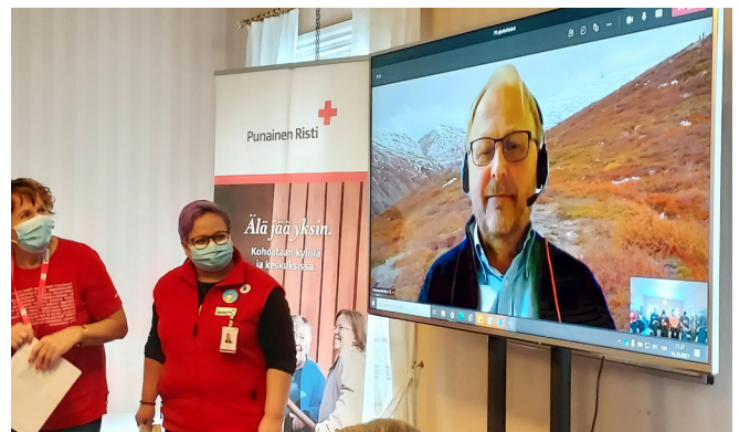
Ystävien ruskatapahtuma järjestettiin Rovaniemellä koronan vuoksi hieman sovellettuuna

Monimuotoisen ystävätoiminnan vapaaehtoisille järjestettiin virkistäytymis- ja koulutuspäivä, Ruskatapaaminen, Rovaniemellä syyskuussa rajoitusten salliessa yleisötilaisuudet. Tapahtumaan osallistui seitsemästä osastosta 49 vapaaehtoista. Vapaaehtoiset edustivat ystävätoimintaa, ruoka-aputoimintaa ja monikulttuurista ystävätoimintaa. Ystävätoiminnan kehittämishankkeen, Kohdataan kylillä ja keskuksissa, Nuorten Kaveritaitoja- hankkeen toimintamallit sekä Monikulttuurisuustoiminta esiteltiin tapahtumassa.