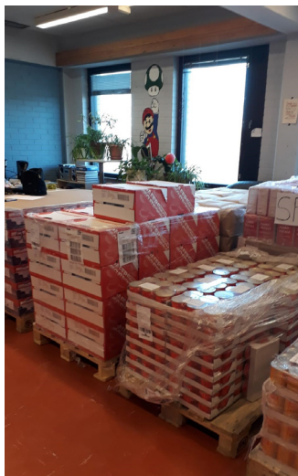
Sodankylän EU-ruokatarvikkeet valmiina jakoon

Hankkeen aikana tehtiin yhteistyötä eri verkostojen kanssa. Verkostoissa mietittiin uusia yhteistyön muotoja sekä vahvistettiin jo aikaisemmin luotuja verkostoja. Hankekauden aikana keskityttiin jo olemassa olevien ruoka-aputoiminnassa mukana olevien paikallisosastojen tukemiseen ja perehdyttämiseen.