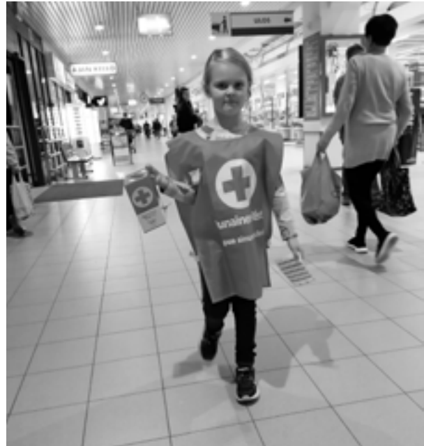
Kuva: Emmi-Riikka Seppälä

Tänä vuonna Nälkäpäivä näkyi hienosti niin lehdissä kuin sosiaalisen median kanavissa. Esimerkiksi Simpeleen nuoret kerääjät sekä Joutsenon sympaattinen hevosekscapilla Elmo ja Samu kerryttivät rutkasti tykkäyksiä somekanavissa niin piiritasolla kuin valtakunnallisesti.