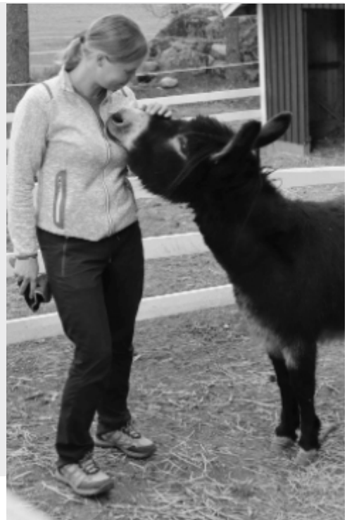
Tuhannen Tarinan Tallo